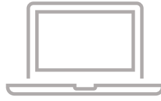
パソコン (簡易自動精算システム インストール済)