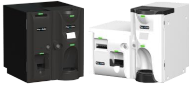
Pay Cube(硬貨投入口付) 「キュービック」または「L型」の2タイプ・ 「黒」「白」の2色から選択