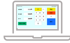
簡易自動精算システム