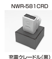
充電クレードル(黒)